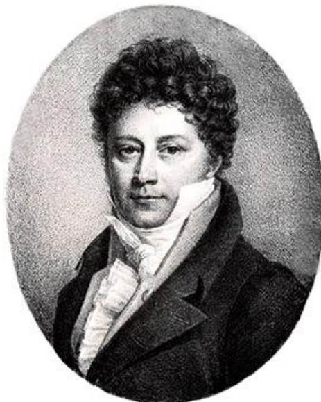
Рисунок 1. Жан-Блез Мартен. Литография Мотта по рисунку Рульмана 7

няет диапазон и качества тенора и баритона, охватывая две с половиной октавы от E 5 до a 1 , верхняя октава берется фальцетом» [10, 305].