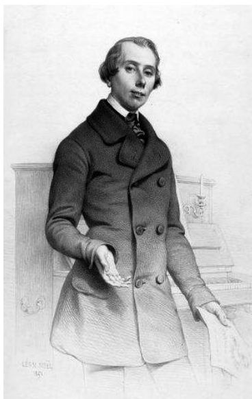
Рисунок 6. Сен-Фуа, рисунок А.-Л. Ноэля 14

Сент-Фуа (Charles-Louis Pubereau или Sainte-Foy, 1817–1877) – тенор-триал, один из лучших исполнителей в парижской Опера Комик. Талантливый интерпретатор ролей в спектаклях Дж. Мейербера, Д. Обера, П.-А. Монсиньи, Н. Изуара, Ж. Оффенбаха. Энциклопедия французского оперного искусства сообщает: «Высокий, стройный, с естественным комическим лицом, очаровательный певец и умный актер, он сыграл более ста ролей и создал их семьдесят» [15].