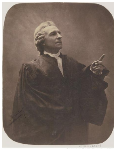
Рисунок 7. Жозеф Кудерк, фотография Надара 15

Этьенн Прадо (Étienne Pradeau, 1817–1895) – комедийный актер и певец, которому принадлежат как теноровые, так и баритоновые партии. Участвуя в постановках многих комических театров (Буф-Паризьен, Пале-Рояль, Варьете, Нувоте) он сыграл несколько сотен ролей в спектаклях Ж. Оффенбаха, Э. Лабиша, Ж. Бизе, Ш. Лекока, Л. Делиба, А. Адана, Г. Серпетта.