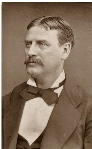
Рисунок 9. Эрве 17

Эрве (Hervé или Louis-Auguste-Florimond Ronger 1825–1892) – будучи не только композитором, режиссером, директором театральной труппы, но также актером и певцом, исполнял теноровые партии как в собственных комических операх, так и в спектаклях своих современников (например, Ж. Оффенбаха).