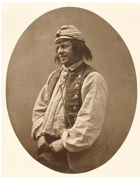
Рисунок 3. Жан Бертелье, фотография Надара 11

Жан-Франсуа Бертелье (Jean-François-Philibert Berthelier, 1828–1888) – тенор-триал и актер, более 30 лет посвятивший комическим спектаклям французских театров Буф-Паризьен, Варьете, Пале-Рояль, Ренессанс, Водевиль, Нувоте, Гаите и Опера Комик. Он создал роли ко многим опереттам Оффенбаха, Лекока, Эрве, Серпетта, Варне и др. Как отмечал Артюр Пужен, «Бертелье – это, как говорится, хладнокровный комик, действие которого на публику, однако, не менее сильное. Он, безусловно, один из самых настоящих, оригинальных и любопытных для изучения артистов, который может встретиться» [11].