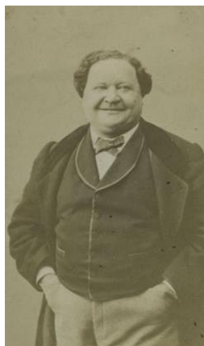
Рисунок 8. Этьен Прадо 16

Этьенн Прадо (Étienne Pradeau, 1817–1895) – комедийный актер и певец, которому принадлежат как теноровые, так и баритоновые партии. Участвуя в постановках многих комических театров (Буф-Паризьен, Пале-Рояль, Варьете, Нувоте) он сыграл несколько сотен ролей в спектаклях Ж. Оффенбаха, Э. Лабиша, Ж. Бизе, Ш. Лекока, Л. Делиба, А. Адана, Г. Серпетта.