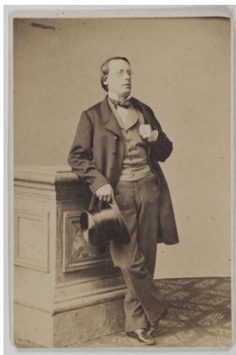
Рисунок 11. Леонс 19

Леонс (Léonce или Édouard-Théodore Nicole, 1823–1900) – комедийный актер и певец театров Буф-Паризьен и Варьете, исполнивший теноровые партии в комических операх Оффенбаха, Делиба, Эрве и др.