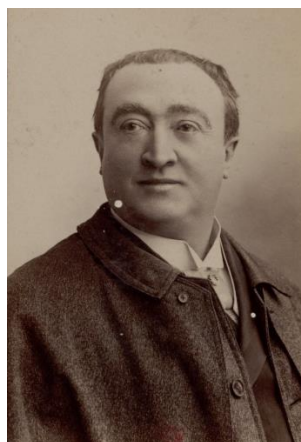
Рисунок 10. Жосе Дюпюи 18

Жосе Дюпюи (José Dupuis, 1833–1900) – актер и певец, работающий в Театрах варьете и водевиля, обладатель легкого тенора, наиболее известный исполнитель ведущих партий в комических операх Оффенбаха, Эрве, а также Лекока.