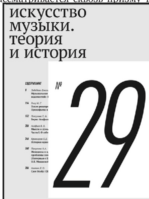
Иллюстрация 4. Журнал Государственного института искусствознания