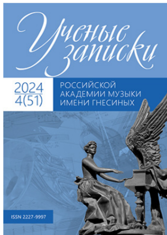
Иллюстрация 8. Ученые записки Российской академии музыки имени Гнесиных

Создаваемые в XX и XXI веках произведения для музыкального театра — постоянный объект музыковедческих исследований. Если взглянуть на проблематику статей, появившихся в печати за три года, то обнаружится целый круг разновекторных историко-теоретических вопросов. Не стремясь дать ис-