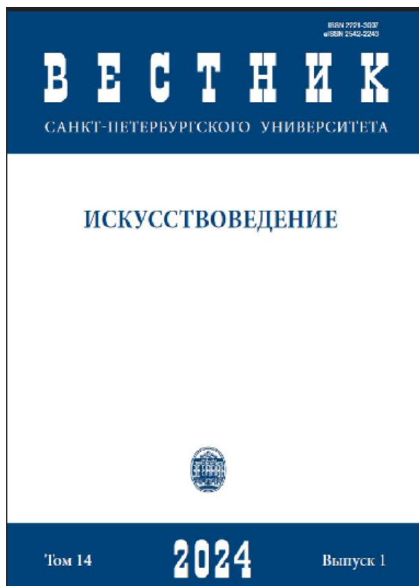
Иллюстрация 2. Журнал Санкт-Петербургского университета