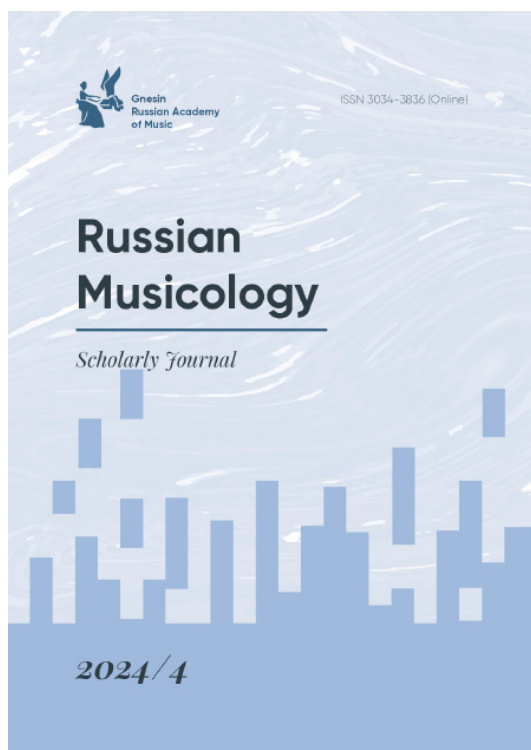
Иллюстрация 7. Russian Musicology

Научные тексты, посвященные изучению современных композиций для хора, складываются, по сути, в особую ветвь российского музыковедения, рельефно обозначившуюся в последние годы. Опубликовано немало статей о хоровой музыке крупных европейских композиторов и целых направлений [62]. Среди фигур, чье творчество стало предметом изучения, — Яннис Ксенакис [63], Маурицио Кагель, Дьёрдь Лигети, Луиджи Нono, Кшиштоф Пендерецкий [64], Ханс Вёрнер Хенце, Хайнц Холлигер [65] и другие. Сформировавшийся в этих исследованиях научный аппарат (изучение хоровой фак-