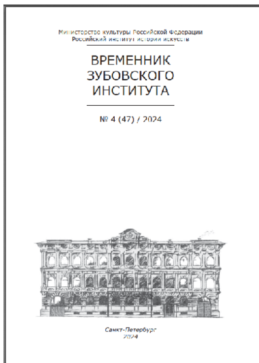
Иллюстрация 3. Журнал Российского института истории искусств