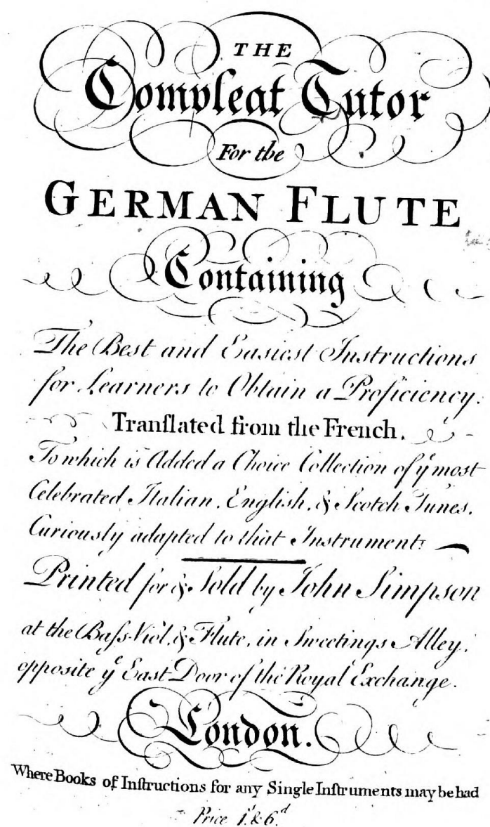
Иллюстрация 2. Титульный лист «The Compleat Tutor for the German Flute» (1742?).

вается «Современным маэстро». Было и другое собрание школ пения и игры на различных струнных и духовых музыкальных инструментах – «The Compleat Musick-Master» [2] (некоторые исследователи приписывают его авторство Уильяму Пирсону, другие просто пишут «various»), выдержавшее на протяжении XVIII века множество переизданий. Однако ни по форме, ни по содержанию материалы двух названных сборников не совпадают.