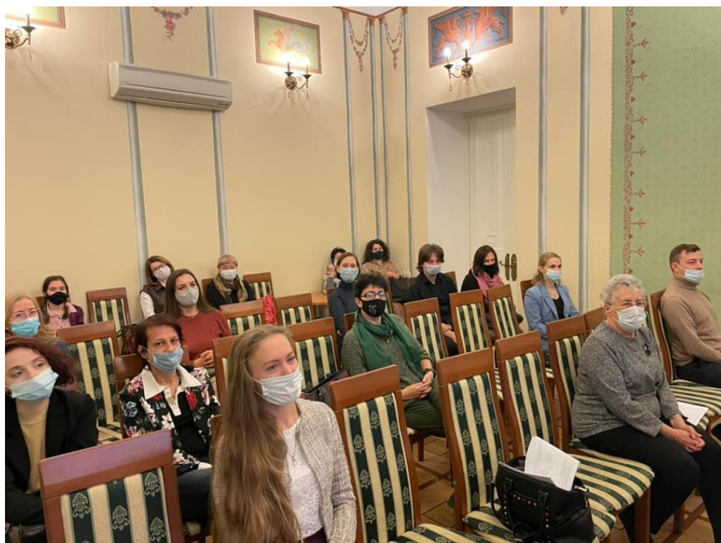
Участники и слушатели конференции «Опера в музыкальном театре: история и современность»

И.С.: Наверное, мне легче ответить на вопрос, что самое необходимое. И ответ этот будет коротким: нужна команда увлеченных единомышленников, которые не делят работу на свою и чужую, всегда готовы подставить плечо и протянуть руку помощи. Это не только коллеги, но и ученики – наши гнесинские студенты, магистранты, аспиранты.